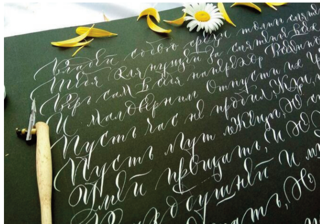
Почерк – это проявление индивидуальности

Нейробиологи подтверждают: когда мы выводим буквы вручную, активируются сразу несколько зон головного мозга – от моторных центров до участков, отвечающих за внима-