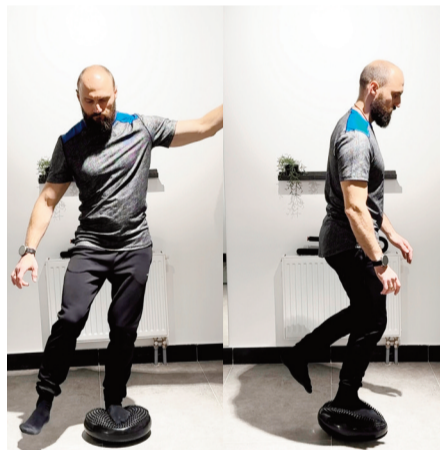
Используйте упражнения на баланс как можно чаще