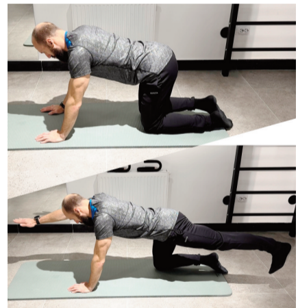
«Квадроплекс» поможет укрепить мышцы и улучшить осанку

способствует лучшему контролю мышечных групп, что крайне важно зимой. Используйте упражнения на баланс как можно чаще, минимум два раза в день, чтобы безопаснее чувствовать себя на скользкой и заснеженной дороге. А еще это улучшит память, внимание и пространственное мышление.