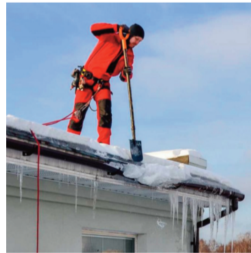
Снизить риски помогут сертифицированные СИЗ

ОЧИСТКУ КРЫШ ОТ СНЕГА ПРОВОДИМ С СОБЛЮДЕНИЕМ ВСЕХ НОРМ И ПРАВИЛ