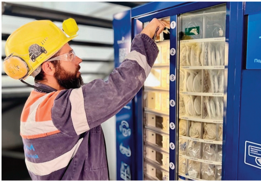
Приобретение вендинговых автоматов – тоже в списке на возмещение

22 декабря 2025 года вступили в силу важные изменения, которые актуальны для большинства предприятий и организаций. Минтруд РФ расширил перечень расходов, подлежащих возмещению из средств Социального фонда России в рамках программы предупредительных мер по сокращению травматизма и профзаболеваний.