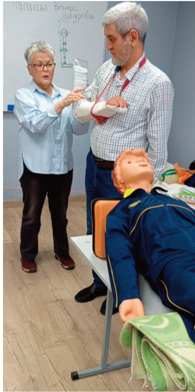
Навыки отработывали друг на друге и на роботе-тренажере