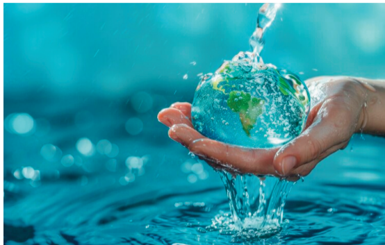
Чистая вода играет огромную роль в жизни человека

Каждый год 31 января человечество напоминает себе: чистая вода – результат сложной и незаметной работы. Эта дата – повод задуматься о том, что мы пьем, и поблагодарить тех, кто делает воду безопасной.